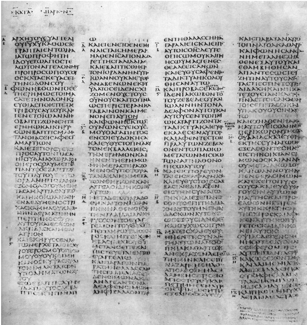
Codex Sinaiticus [IV sec.], inizio del Vangelo secondo Marco [f. 18v]